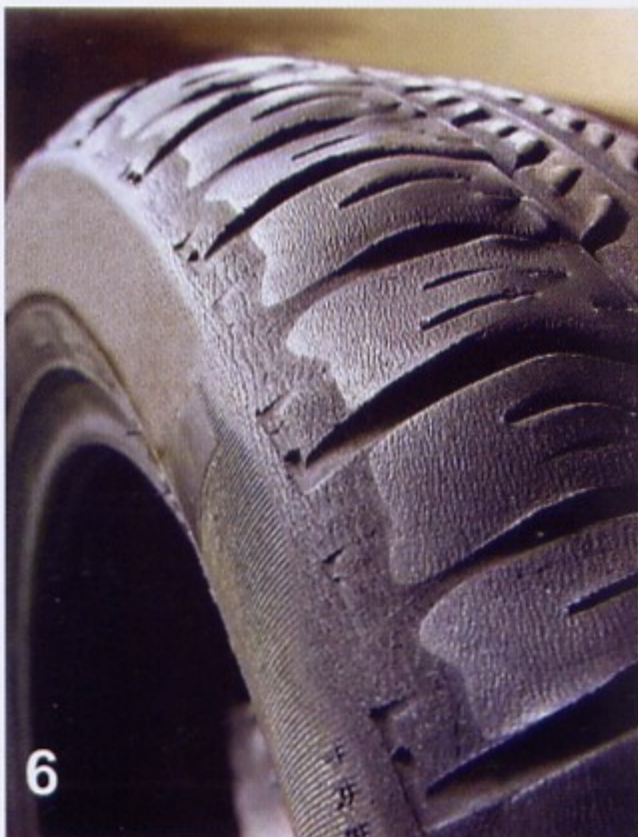
6 Usage intense